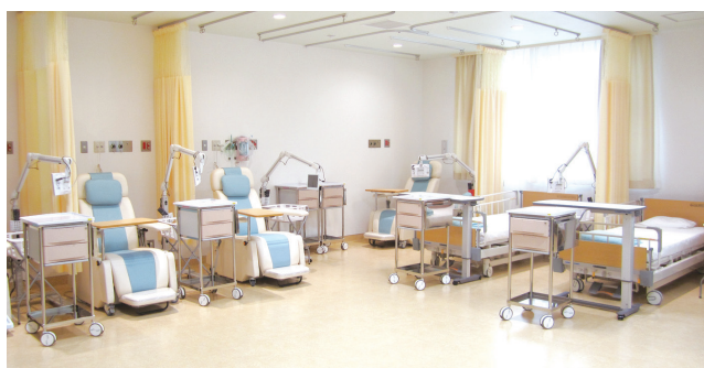
外来化学療法室の様子

現在は、化学療法も新しいお薬や副作用対策の進歩などにより、お家での生活やお仕事を続けながら、多くの治療が通院でできるようになりました。当院でも、患者さん・ご家族に安心して治療を受けて頂けるように外来化学療法室を設けています。外来化学療法室では、診療科の医師を中心に、専従の看護師や薬剤師、管理栄養士、事務職等がチームで、患者さんに安全かつ安心して治療を受けて頂けるように取り組んでいます。副作用や、ご心配なこと、疑問などいつでもスタッフにご相談頂けます。